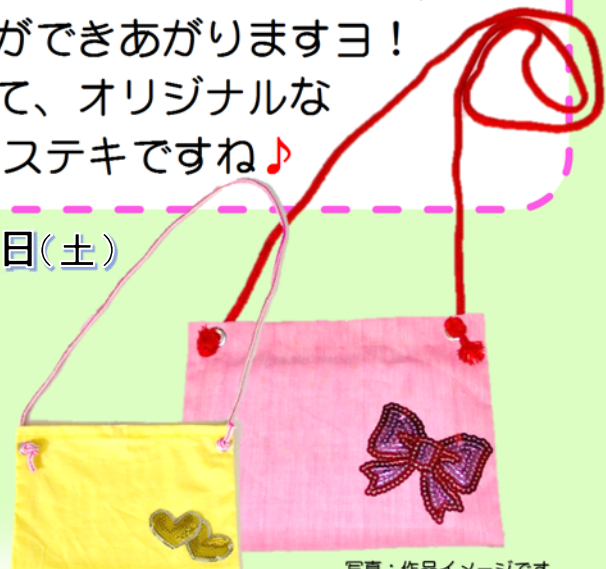
写真: 作品イメージです